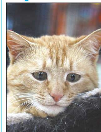
Очаровательный котик Файр ждет своего человека! Ему 1,5 года, он привит и кастрирован

Наша редакция и приют «Второй шанс» продолжают специальную рубрику. Вдруг среди опубликованных четвероногих обитателей приюта вы найдете свое счастье.